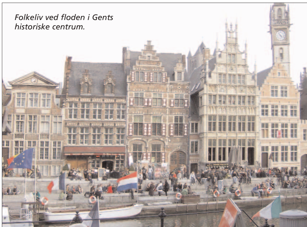
Folkeliv ved floden i Gents historiske centrum.